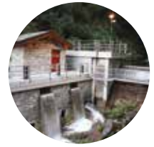
HYDRO POWER PLANTS